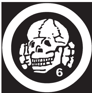
Death In June - Logo

Er bezichtigt den Musiker der Oberflächlichkeit, weil er eine Besinnung auf die Wurzeln