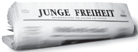
Titelseite der Jungen Freiheit

In der anschließenden Zeitschriftenkritik zur Ausgabe fünf der Blauen Narzisse , bietet Werner Olles dem Leser nochmals eine kurze Einführung, lobt ein weiteres Mal das Engagement, mit dem die Macher der „Ersten Chemnitzweiten Schülerzeitung“ ihr Projekt betreiben und wendet sich schließlich der genaueren Betrachtung zweier Texte zu.