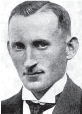
Albert Leo Schlageter

Nachdem die Marinebrigade auf Druck der Alliierten aufgelöst werden muss, schließt sich Schlageter im Januar dem Freikorps Hauenstein in Oberschlesien an. Über dieses Freikorps ist in dem bereits oben erwähnten Buch zu erfahren: „Eine der Hauptaufgaben Hauensteins wird die Ausschaltung deutscher Spitzel und Verräter. In diesem gnadenlosen Kampf gibt es nur eine Devise: VERRÄTER VERFALLEN DER FEME! Wenn möglich, spart man für diese Kreaturen, für die ein rascher Tod zu schade ist, sogar die Kugel.“ Nach dieser Devise wurde übrigens auch der damalige Außenminister der Weimarer Republik, Walter Rathenau, im Juni 1922 von rechtsradikalen Freikorpsoffizieren ermordet.